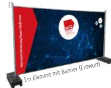
Ein Element mit Banner (Entwurf)

* KunststoffDIALOG, AutomotiveDIALOG, MetallDIALOG