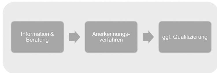
Abb. 1: Struktur des Anerkennungsprozesses

die anerkennenden Stellen erheben: Sie betragen oftmals zwischen 100 und 600 Euro, in Gesundheitsberufen teilweise deutlich mehr. In Anerkennungsstellen bei Behörden einiger Bundesländer sind die Gebühren faktisch jedoch nicht höher als 150 Euro (zum Beispiel Mecklenburg-Vorpommern, Schleswig-Holstein) oder sogar (wie in Sachsen-Anhalt) gesetzlich auf maximal 600 Euro beschränkt (vgl. BMBF 2015, S. 119 ff.). Bei reglementierten Berufen können weitere Aufwendungen für Sprachtests sowie vorbereitende Kurse hinzukommen. Insgesamt besteht somit ein breiter Gebührenkorridor, der je nach Verfahrensergebnis, anerkennender Stelle, Referenzberuf, Verfahrensaufwand und Ausbildungsland verschieden ist. Die Vielfalt möglicher Variablen erschwert dabei die genaue Vorhersage der anfallenden Kosten im Einzelfall.